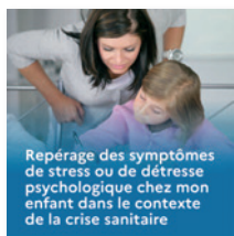
Repérage des symptômes de stress ou de détresse psychologique chez mon enfant dans le contexte de la crise sanitaire

fragilité psychologique dans le contexte de la crise sanitaire » ; des documents d'information destinés aux professeurs, mais également aux parents et aux élèves .